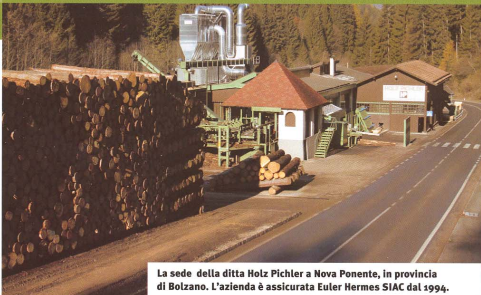
La sede della ditta Holz Pichler a Nova Ponente, in provincia di Bolzano. L'azienda è assicurata Euler Hermes SIAC dal 1994.

T ra le splendide abetaie dell'Alto Adige, più precisamente in Val d'Ega nel tranquillo paese di Nova Ponente, in provincia di Bolzano, si trova un'azienda che dal 1946 lavora il legno, il tesoro forse più prezioso di queste zone. Con una produzione annuale di circa 45.000 mc. di segazione di tronchi di abete e pino e un giro d'affari di circa 9 milioni di euro, la Holz Pichler, segheria dell'Alto Adige ( www.holz-pichler.com ) è un'impor-